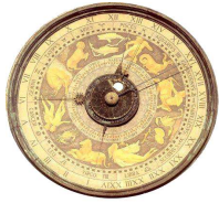
ORDINE degli INGEGNERI della PROVINCIA di CREMONA