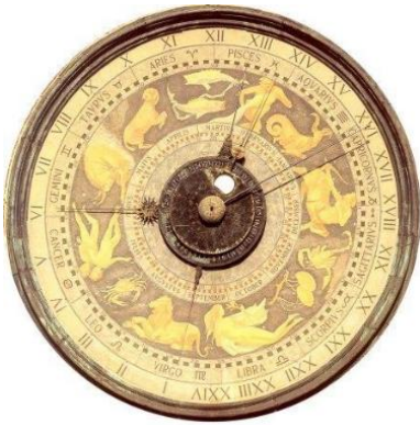
ORDINE degli INGEGNERI della PROVINCIA di CREMONA Via Palestro, 66 - Cremona